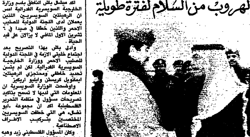
الحسين في وداع صدام في مطار عمان

أكد الرئيس العراقي صدام حسين ان الحكومة العراقية لن تستطيع الهروب من السلام لفترة طويلة من الزمن وخاصة تجاه المبادئ والمبادئ الواضحة التي تضمنتها معاهدة العراق الاخيرة. واصف الرئيس العراقي في تصريحه لاداعة عمان في ختام زيارة قصيرة قام بها للارمن. ان الايرانيين يحتلون حتى يتخلصوا من عبواتهم التي تعرف اسمها قناعات الشعوب الإيرانية باهمية السلام والعلاقات السليمة.